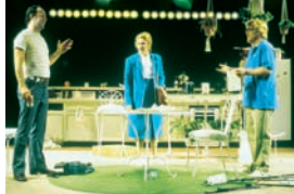
"True West". Diseñador de iluminación: Brian MacDevitt.

Estos colores de la gama de azules y de lavandas actúan como complementarios, tanto para los de las áreas frías como para los de las áreas cálidas, o en aquellos casos en que sólo se desean un toque de color. Los difusores Supergel ofrecen al iluminador una flexibilidad adicional. Los colores neutros aparecen cálidos o fríos por contraste con otros "fríos y cálidos".