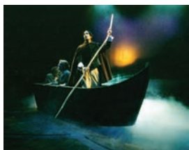
"I Promesi Spessi". Diseñador de iluminación: Patrick Latronica.

El azul y el violeta son los colores de la zona fría del espectro. Probablemente hay más tonos de azul en Supergel que en ningún otro color, porque prácticamente cualquier representación escénica precisa algún tono de la paleta de los azules. La luz azul cambia cuando se combina con otros colores, por lo que es necesaria una gama amplia. Los azules pálidos actúan como mantenedores de la "temperatura de color".