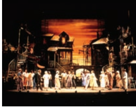
"Cattfish Row". Diseñador de iluminación: Ken Billington.

Algunos de estos colores son repetición de los citados en áreas de actuación/tonos cálidos, pero este grupo de colores se limita a los que más se aproximan a la luz solar. La luz solar real cambia ligeramente los colores a medida que avanza el día, de forma que los colores se deben elegir y cambiar para que coincidan con la hora del día.