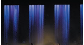
Diseñador de iluminación: JoJo Tillman.