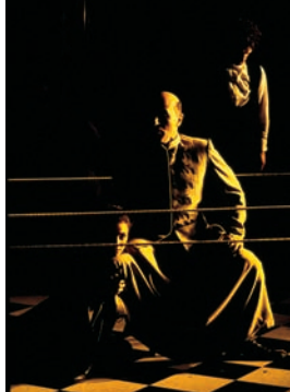
"The Changeling". Diseñador de iluminación: Donald Holder.

Este gran grupo de colores se puede utilizar para efectos especiales como el fuego, los fantasmas, etc., pero los efectos especiales incluyen realces especiales de color que añaden la nota justa a una imagen escénica. Las descripciones le ayudarán a localizar el color exacto que necesita. Este grupo, por encima de todos los demas, depende de su personalidad y estilo.