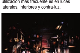
"Catfish Row". Diseñador de iluminación: Ken Billington.

Los colores que se han elegido para este grupo, se utilizan con frecuencia con otros fines, pero los tonos de ámbar, rojo, azul y verde dan un resultado especialmente bueno en cicloramas. Los cicloramas se utilizan en general para definir el horizonte de la escena. Algunos escenarios utilizan materiales de color azul para sus cicloramas y éstos se deben iluminar únicamente con filtros azules y verdes. Estos tonos de azul y verde se utilizan mucho en escenas de noche y de luz de luna, que necesitan realces adicionales de color. Como en el caso de los colores de realce cálidos, su utilización más frecuente es en luces laterales, inferiores y contra-luz.