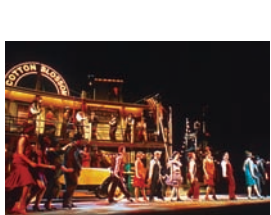
"Showboat". Diseñador de iluminación: Richard Pilbrow.

Estos tonos de azules y verdes se utilizan mucho en escenas por la tarde o, a la luz de la luna, en que se precisa realces adicionales del color. Como los colores de realces cálidos, se utilizan con mayor frecuencia en luces laterales inferiores y de contra-luz.