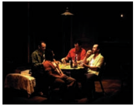
"Un tranvía llamado deseo". Diseñador de iluminación: Kevin Rigdon.

El color cálido sugiere la luz del día y la luminosidad. En general se utilizan para escenas que transcurren por la mañana o a la caída de la tarde.