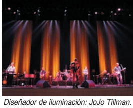
Diseñador de iluminación: JoJo Tillman.