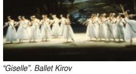
"Giselle". Ballet Kirov