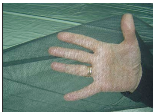
Gasa Simple Negra