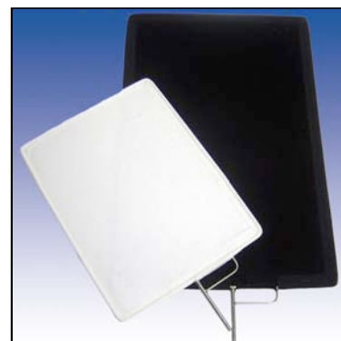
Banderas fabricadas con Molton Negro y Seda Artificial Blanca