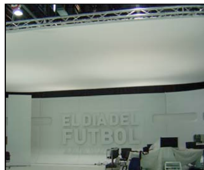
Palio confeccionado con Grid Cloth