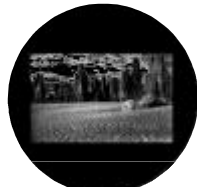
BLANCO & NEGRO